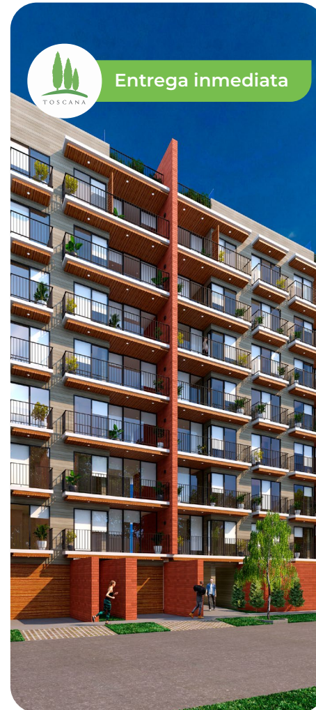
Jr. Carlos Alayza y Roel N° 2616 LINCE