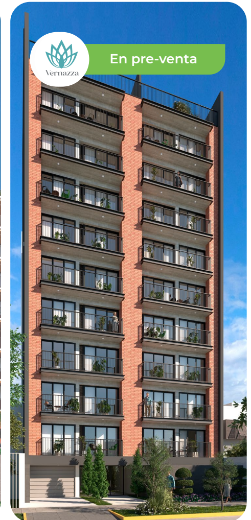
Jr. Inca Rípac N° 338 JESÚS MARÍA