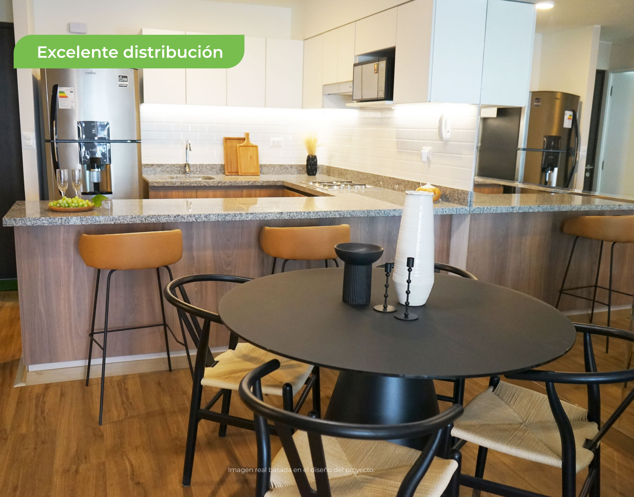
Imagen real basada en el diseño del proyecto.