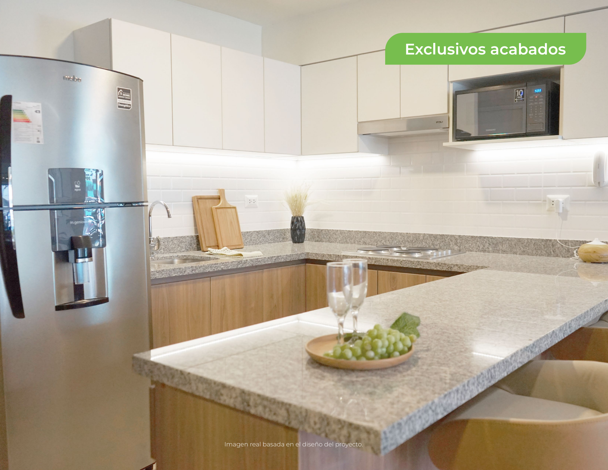
Imagen real basada en el diseño del proyecto.