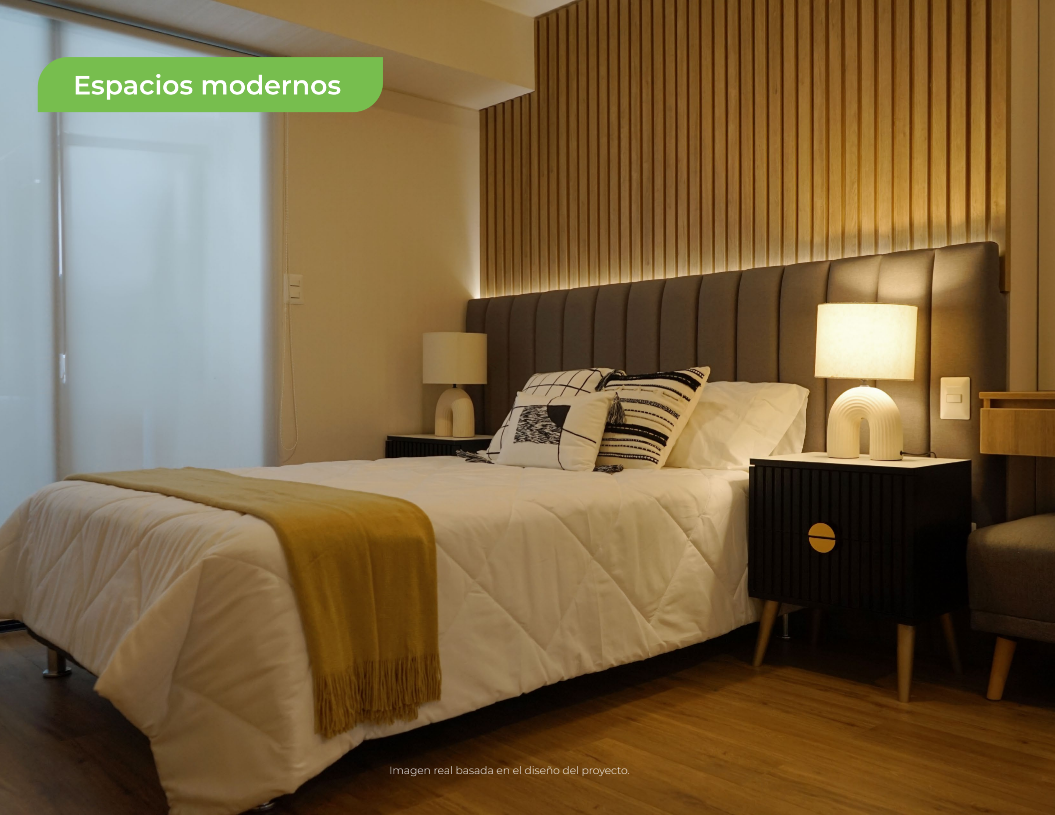
Imagen real basada en el diseño del proyecto.