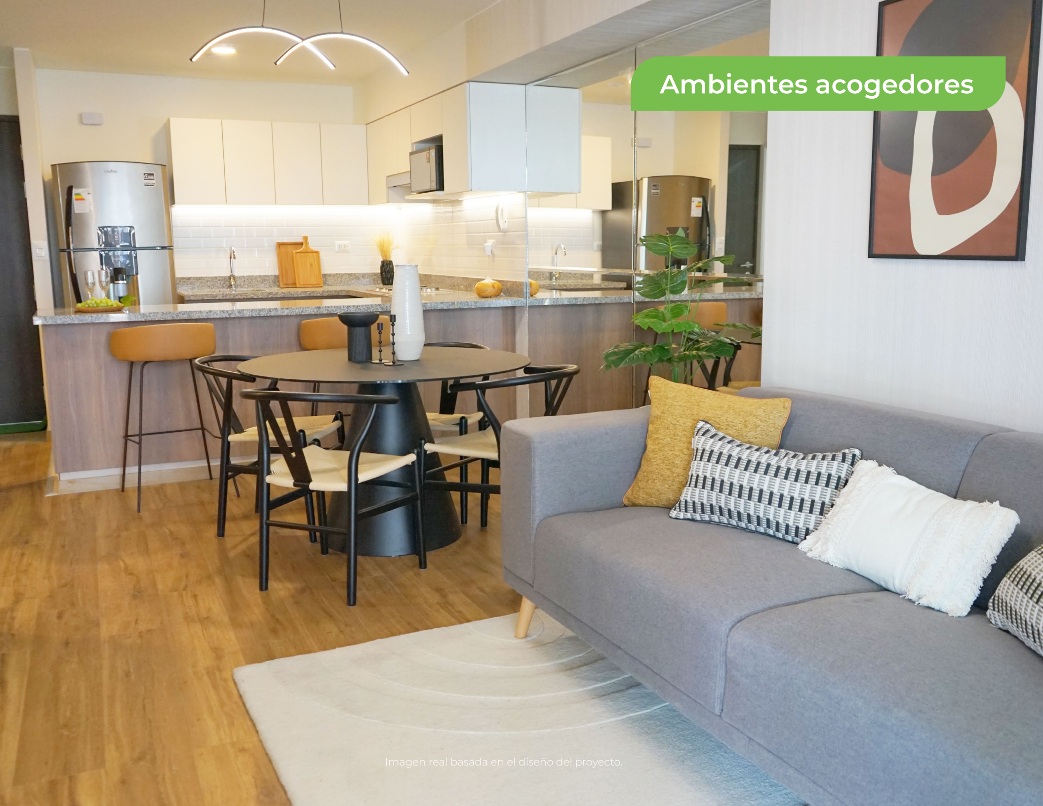
Imagen real basada en el diseño del proyecto.