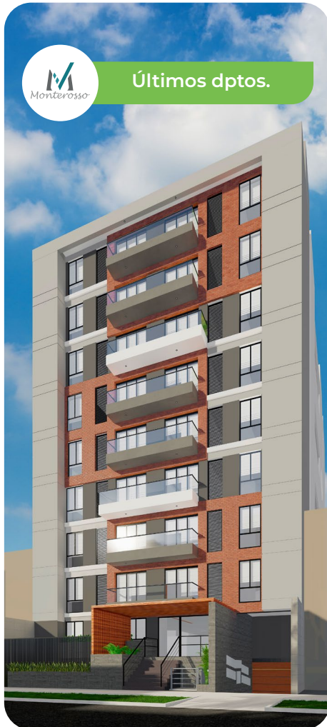
Jr. Coronel Félix Zegarra N° 1045 JESÚS MARÍA