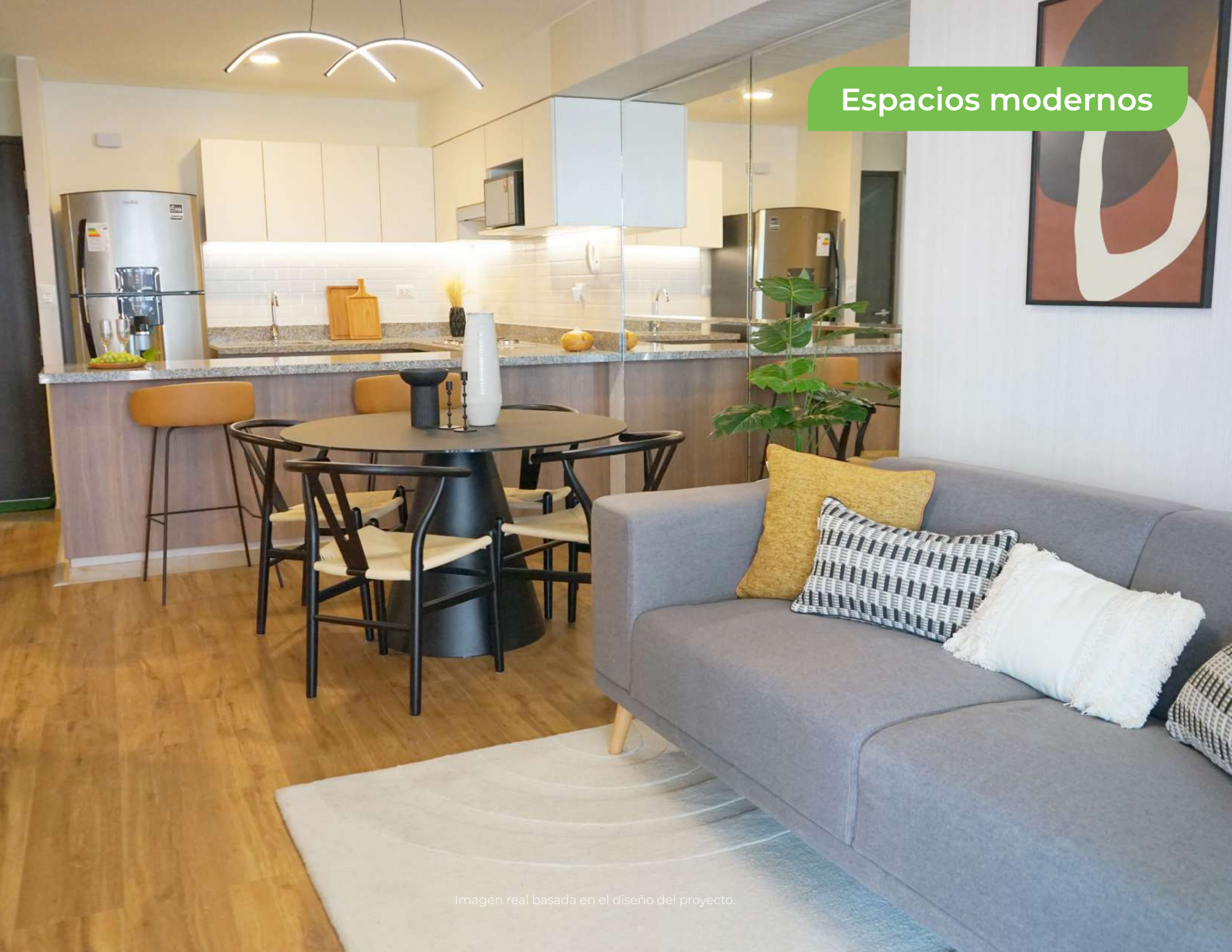
Imagen real basada en el diseño del proyecto.