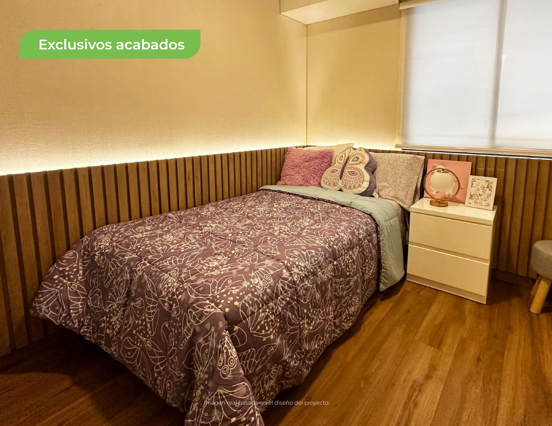
Imagen real basada en el diseño del proyecto.