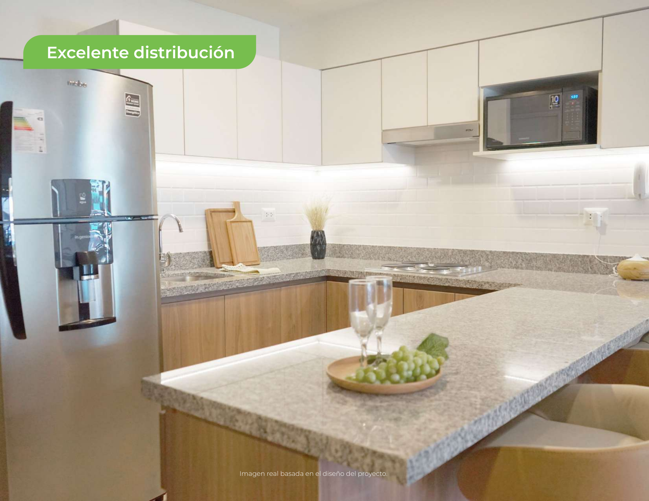
Imagen real basada en el diseño del proyecto.