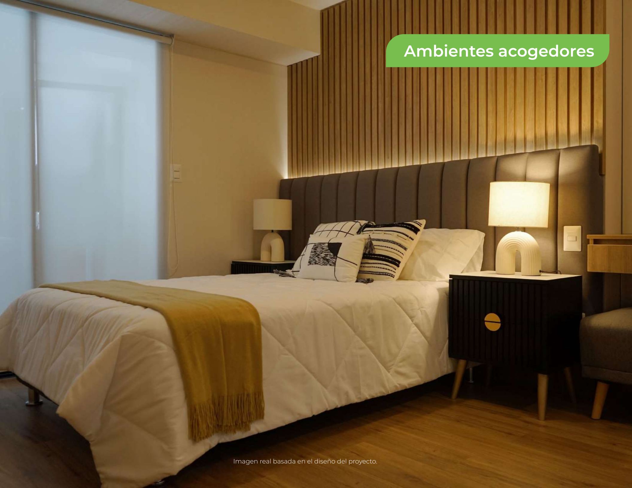
Imagen real basada en el diseño del proyecto.