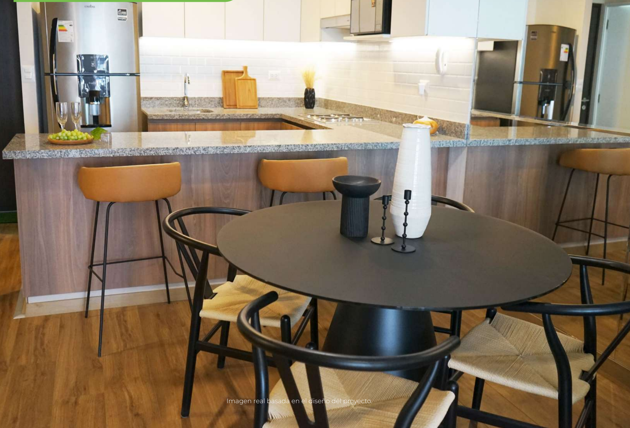
Imagen real basada en el diseño del proyecto.