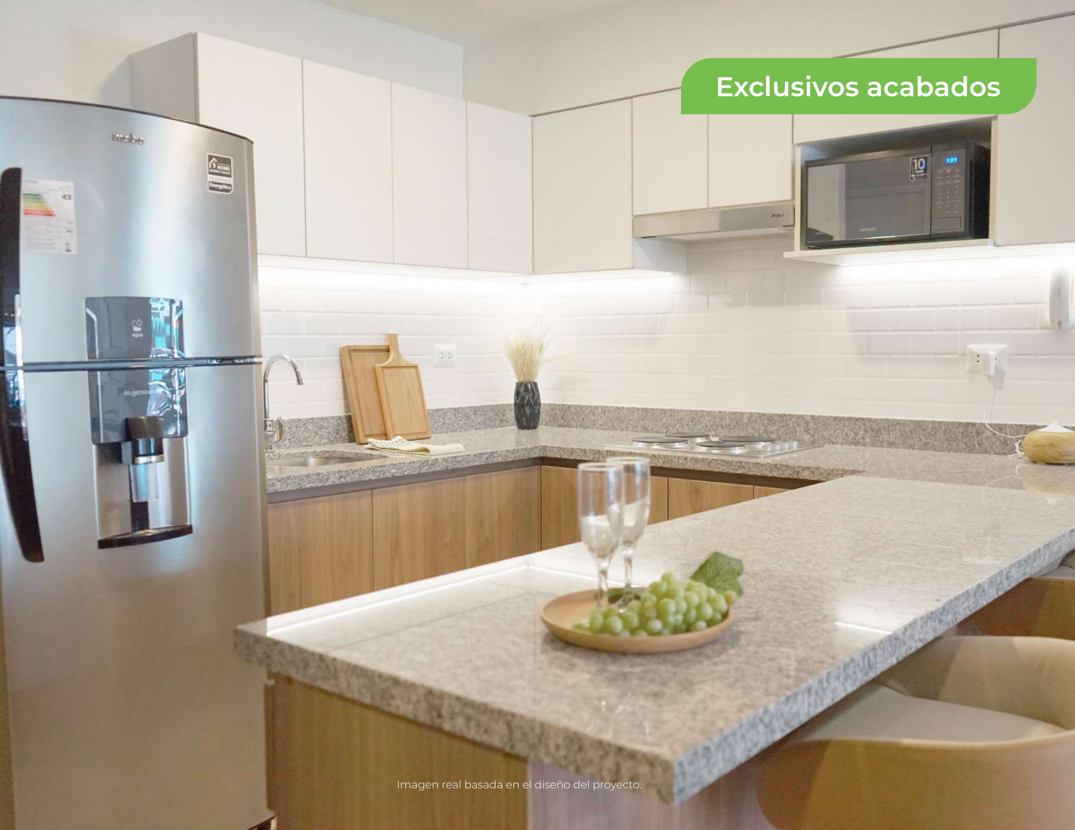
Imagen real basada en el diseño del proyecto.