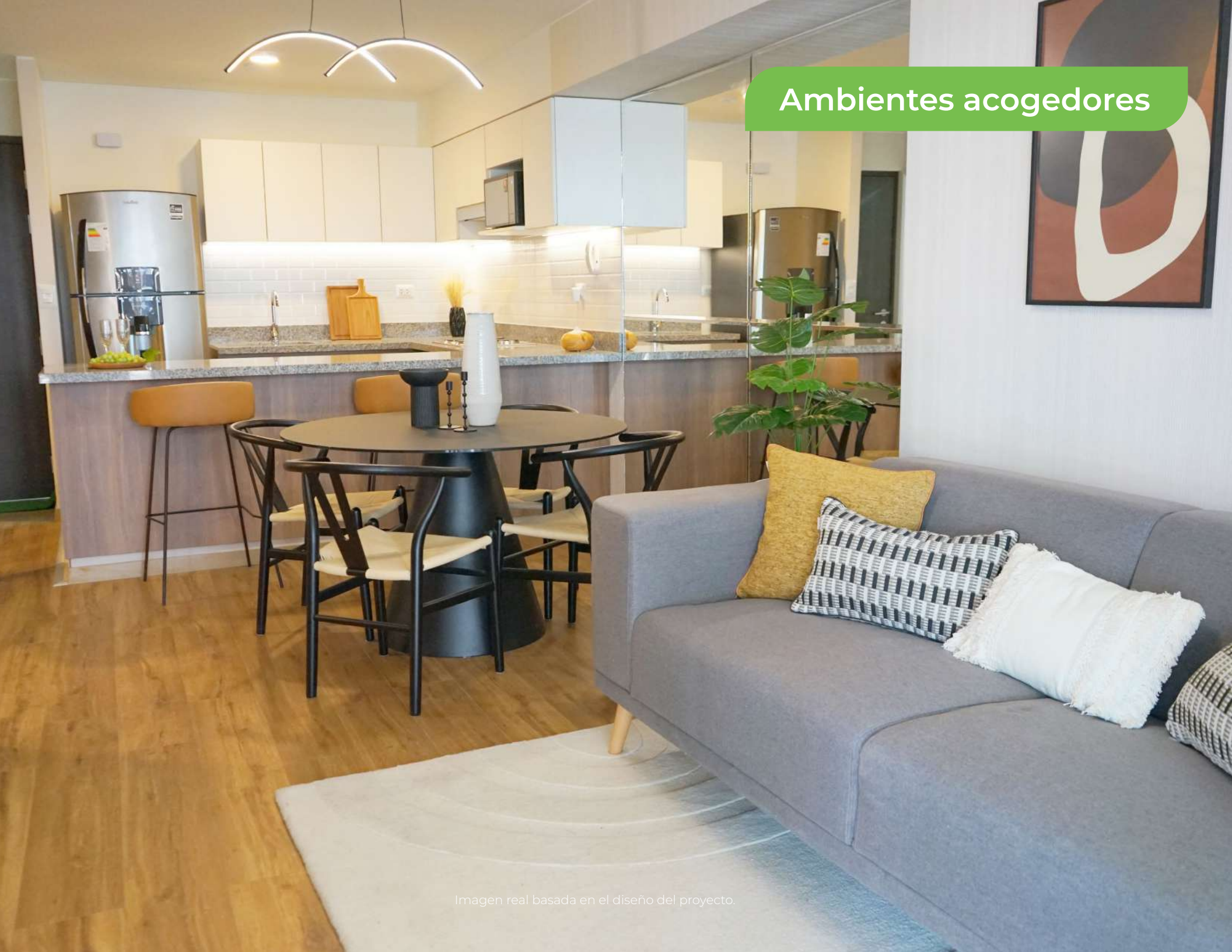
Imagen real basada en el diseño del proyecto.