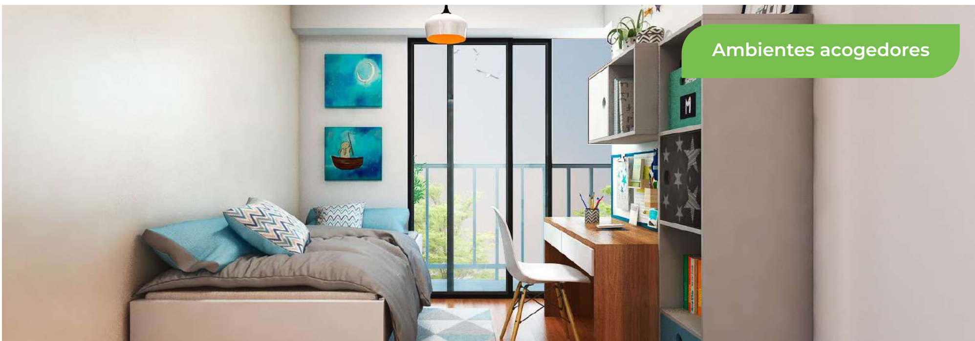
Imagen de referencia sujeta a modificaciones de acuerdo con el diseño del proyecto y disponibilidad de departamentos.