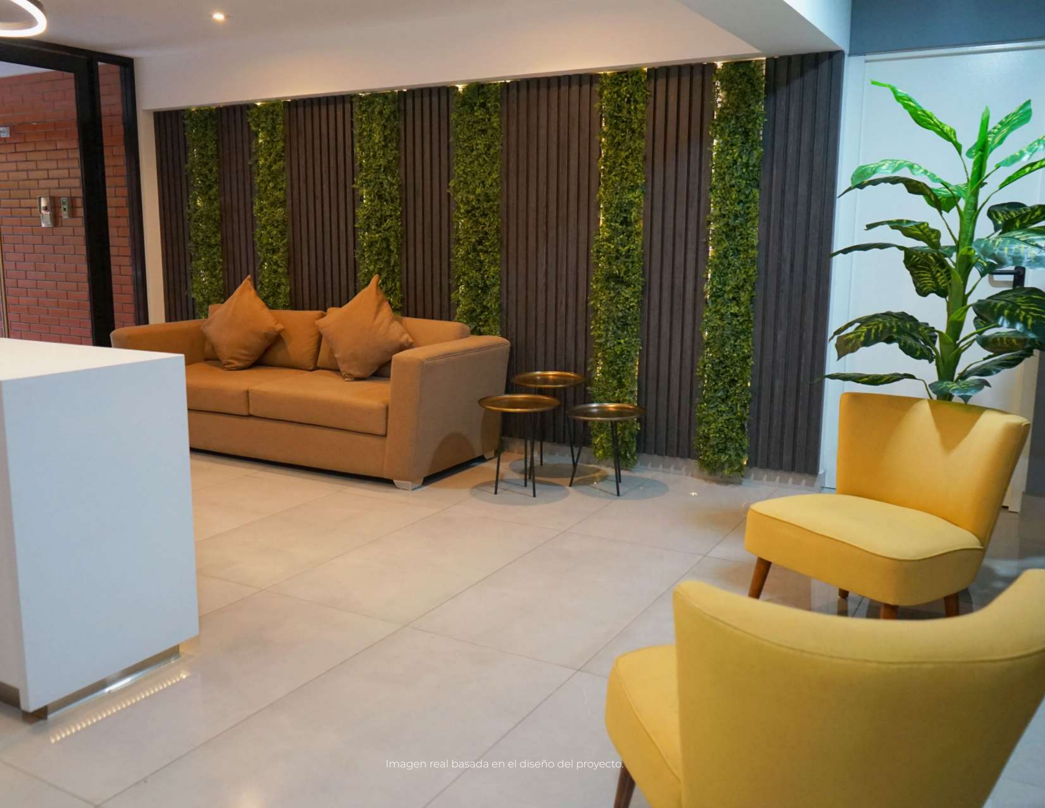
Imagen real basada en el diseño del proyecto.