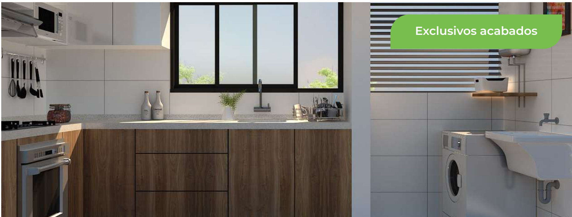
Imagen de referencia sujeta a modificaciones de acuerdo con el diseño del proyecto y disponibilidad de departamentos.