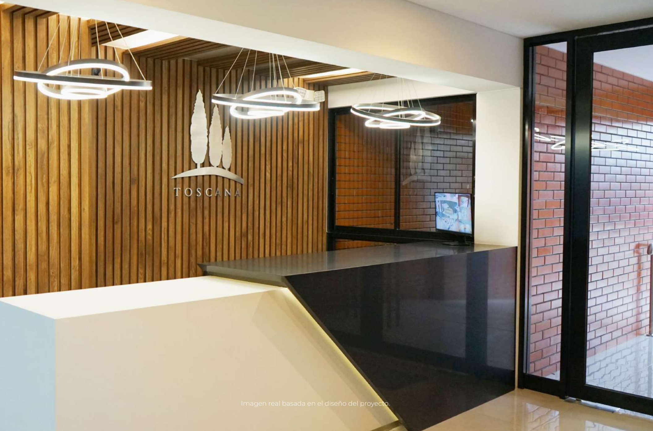
Imagen real basada en el diseño del proyecto.