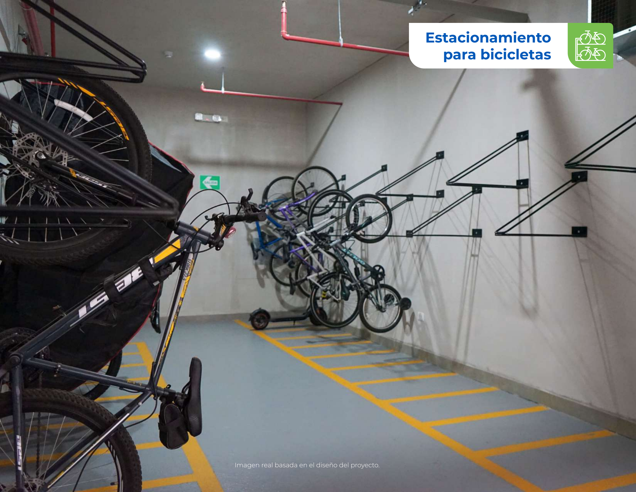
Imagen real basada en el diseño del proyecto.