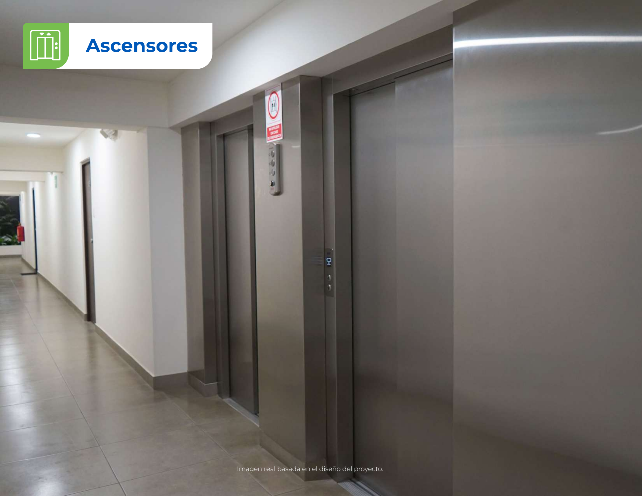
Imagen real basada en el diseño del proyecto.